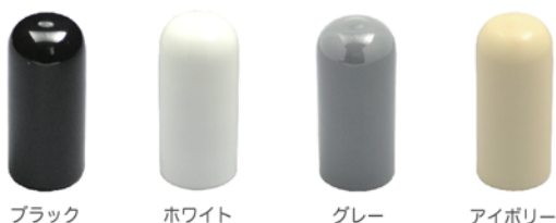
ブラック ホワイト グレー アイボリー