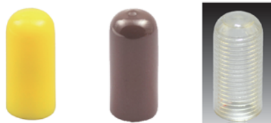
イエロー【特注色】 ブラウン【特注色】 クリア【特注色】